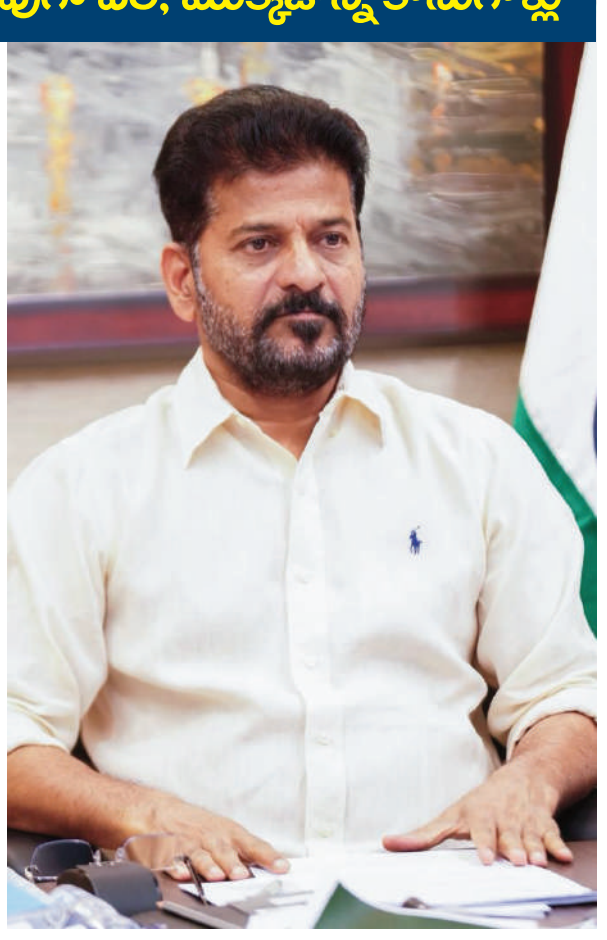
సజావుగా వరి, మొక్కజొన్న కొనుగోళ్లు

ధాన్యం వెంటనే లారీల్లో తరలించాల్సిందే అవసరమైతే పోలీస్ సాయంతో ధాన్యం సేకరణ లారీలు పంపంకుంట్ క్రిమినల్ కేసులు పెట్టండి కలెక్టర్లకు సిఎం రేవంత్ రెడ్డి స్పష్టమైన ఆదేశాలు ధాన్యం సేకరణ, మొక్కజొన్న కొనుగోళ్ల విషయంలో నిర్లక్ష్యం వహిస్తే సహించేది లేదని ముఖ్యమంత్రి రేవంత్ రెడ్డి స్పష్టం చేశారు. ధాన్యం లోడ్ తరలించేందుకు బప్పందం మేరకు సరిపడా లారీలను అందుబాటులో ఉంచని కాంట్రాక్టర్లను ఉపేక్షించొద్దని.. అవసరమైతే అలాంటి వారిపై క్రిమినల్ కేసులకు వెనకాడవద్దని ముఖ్యమంత్రి ఆదేశించారు. మొక్కజొన్న పంట ఎక్కువగా వచ్చే జిల్లాల కలెక్టర్లు కొనుగోళ్ల విషయంలో అప్రమత్తంగా ఉండాలన్నారు. హైదరాబాద్, మే 12 : ఎక్కడా రైతులకు ఇబ్బందులు కలగొద్దని తెలిపారు. అవసరమైన చోట పోలీస్ సహాయం తీసుకుని కలెక్టర్లు ధాన్యం సేకరణ సాఫీగా జరిగేలా చూడాలని సూచించారు. మంగళవారం.. జిల్లా కలెక్టర్లతో సీఎం వీడియో కాన్ఫరెన్స్ నిర్వహించారు. రాష్ట్రంలో మొక్కజొన్న కొనుగోలు, వరి ధాన్యం సేకరణపై జిల్లా కలెక్టర్లతో ముఖ్యమంత్రి సమాక్ష చేశారు. కొనుగోలు కేంద్రాల్లో రైతులకు -మిగతా 2 లో..